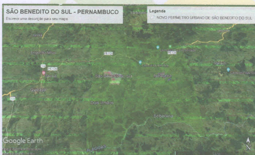
FIGURA 01 – DELIMITAÇÃO DA CIDADE DE SÃO BENEDITO DO SUL – PE

Tendo em vista o crescimento demográfico da cidade de São Benedito do Sul, em Pernambuco, se faz necessário o redimensionamento da demarcação urbana do município, no qual auxiliará em novas captações de recurso para unidades habitacionais, como também proporcionará uma maior arrecadação de impostos, como por exemplo IPTU, desta forma segue imagens da nova demarcação do perímetro urbano, como também o Memorial Descritivo.